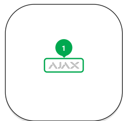
1 – Logo mit Lichtanzeiger